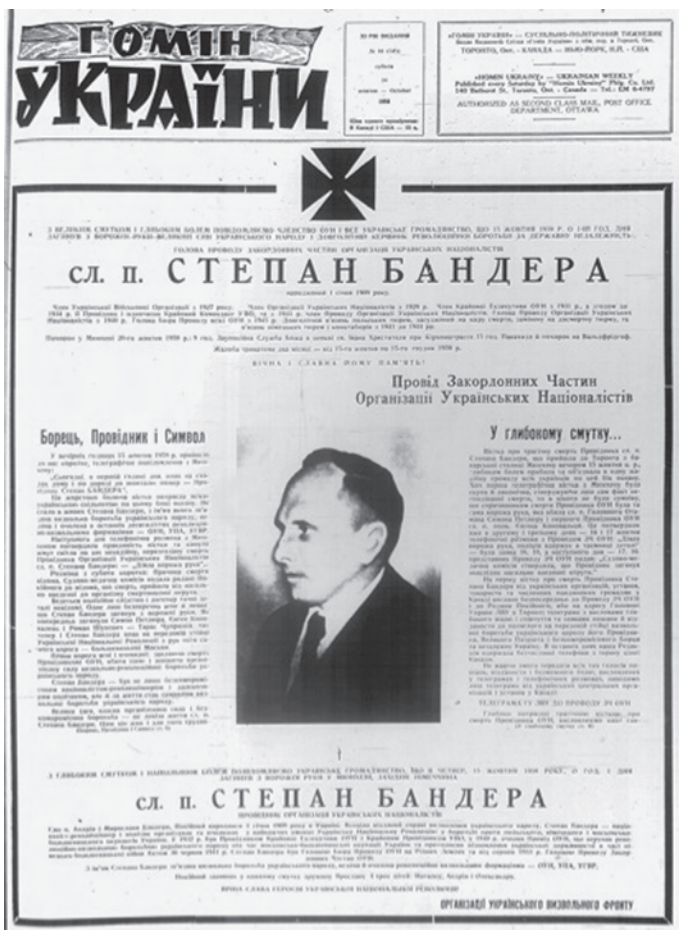
1. Fotografia okładki książki autorstwa Manoly'ego R. Lupula, The Politics of Multiculturalism. A Ukrainian-Canadian Memoir (Edmonton i Toronto 2005).

Analyzing the Bandera cult in Edmonton I tried to elaborate on how the politics of multiculturalism that were introduced in Canada in 1971 corresponded with the neo-fascist tendencies of the Ukrainian radical right groups. Furthermore I tried to find out why Ukrainian radical right émigrés welcomed the politics of multiculturalism and how they used them for the process of cultivating their radical right and neo-fascist cultural activities.