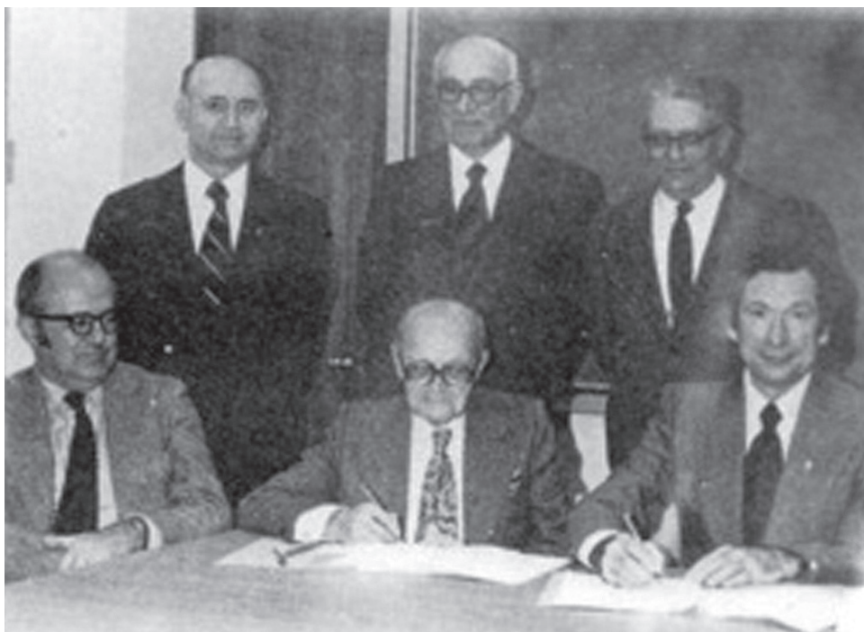
3. Pierwsza strona pisma „Homin Ukrajiny”, 24 III 1959.