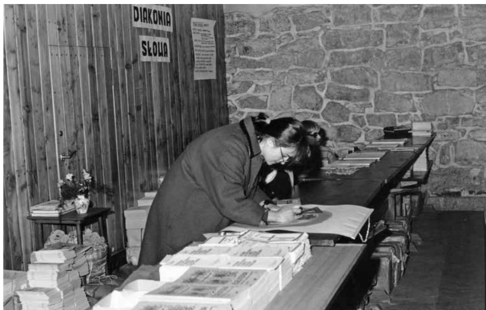
3. Stoisko diakonii słowa podczas VI Krajowej Kongregacji Odpowiedzialnych Ruchu Światło-Życie, Jasna Góra 27 lutego – 2 marca 1981 r.

z nagraniami. Kasety były przygotowywane przez komórkę Ruchu Światło-Życie, zwaną Diakonią Środków Przekazu 54 .