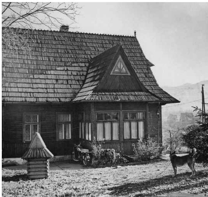
1. Dom ruchu oazowego w Zakopanem na Pardałowce, w którym zlokalizowano Redakcję Wydawnictw Ruchu Światło-Życie.

Pracownikami wydawnictwa były panie z Zespołu Niepokalanej. Do głównych zadań, jakie ks. Blachnicki postawił przed wydawnictwem, należały: przygotowywanie, drukowanie i kolportaż materiałów formacyjnych dla Ruchu Światło-Życie i związanych z nim dzieł. W zamierzeniach twórcy wydawnictwo było częścią Diakonii Słowa (jednej z diakonii – komórek Ruchu Światło-Życie) i miało następujące działy: produkcja (redakcja merytoryczna i redakcja techniczna), reprodukcja (miejsca powielania, drukowania – nie własne) i dystrybucja w Diakoniach Słowa (w znaczeniu węższym, jako punkty sprzedaży bezpośredniej) 35 . Książ Blachnicki starał się związać redakcje poszczególnych działów wydawniczych z centralnymi diakoniami Ruchu Światło-Życie. W 1981 r. ich układ przedstawiał się następująco: w Krościenku – Diakonia Świadectwa i Diakonia Oaz Rekolekcyjnych; w Lublinie – Diakonia Ewangelizacji, Diakonia Deuterokatechumenatu, Diakonia Liturgii oraz Diakonia Formacji Diakonii; w Krakowie – Diakonia Wspólnoty Rodzinnej; w Podkowie Leśnej – Diakonia Modlitwy i Diakonia Wspólnoty Lokalnej. W Zakopanem przygotowywano materiały związane głównie z Centralną Diakonią Jedności oraz wszystkie inne nieprzyporządkowane do poszczególnych działów 36 .