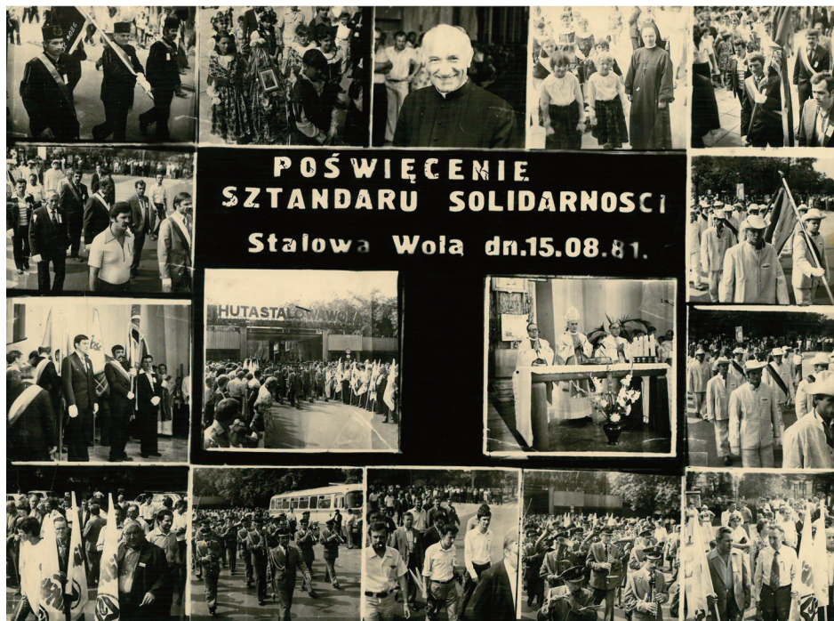
Zdjęcie pamiątkowe z uroczystości poświęcenia sztandaru „Solidarności” z 15 VIII 1981 r.