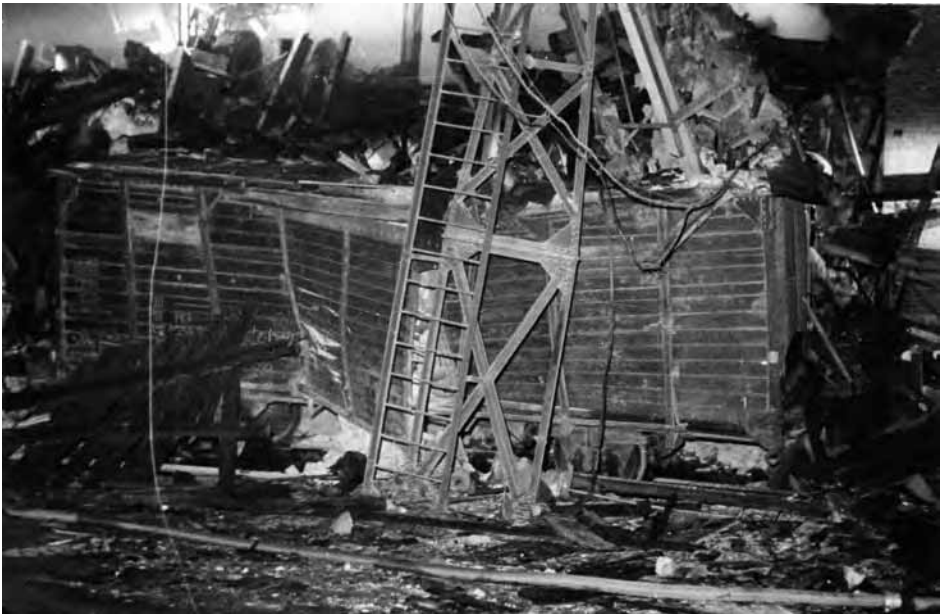
Zniszczony budynek dekstryniarni (AIPN Po, 04/3280, t. 2)