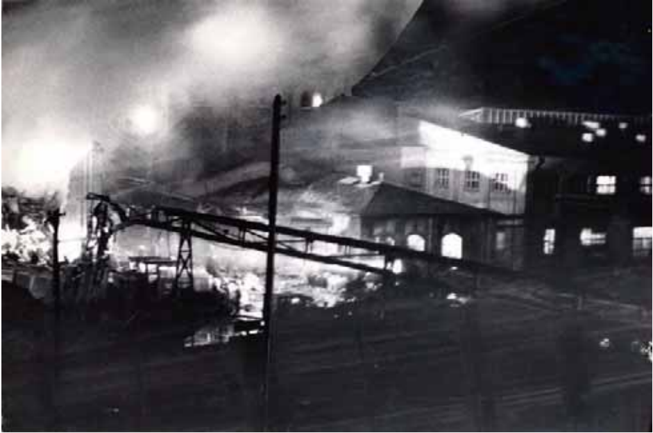
Budynek dekstryniarni w czasie pożaru