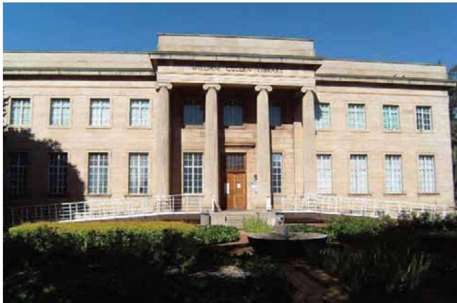
Budynek Biblioteki Williama Cullena Uniwersytetu Witwatersrand w Johannesburgu

Komisja Archiwalna ustanowiona przez władze apartheidowe na mocy ustawy o archiwach nr 6 z 1962 r. nie była reprezentatywna, gdyż jej członkami byli wyłącznie biali mężczyźni – naukowcy akademicy. Ponadto w swojej pracy nie służyła większości zainteresowanych zbiorami.