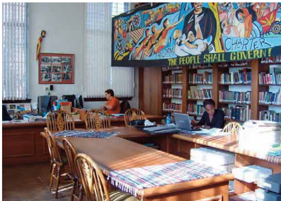
Czytelnia Archiwum Wydziału Dokumentacji Historycznej Uniwersytetu Witwatersrand w Johannesburgu