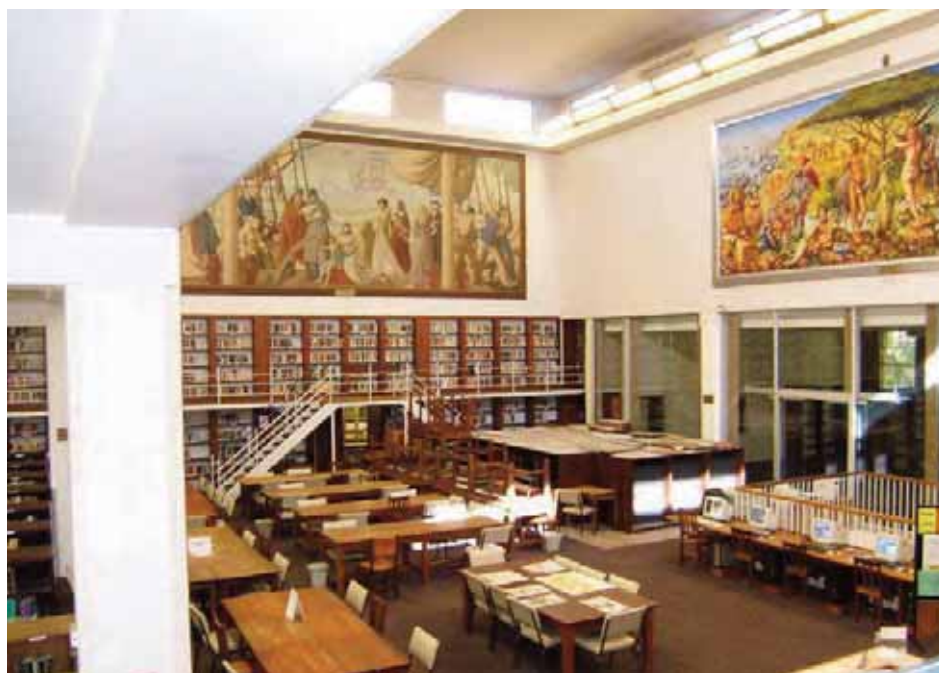
Czytelnia Biblioteki Williama Cullena

działania, większe kompetencje zawodowe i doświadczenie. Publikowane przez SASA pismo „South African Archives Journal” uległo głębokiej przemianie poprzez uwzględnienie szerszej palety opinii, stało się bardziej otwarte na publiczne debaty i aktywniej w nich uczestniczyło.