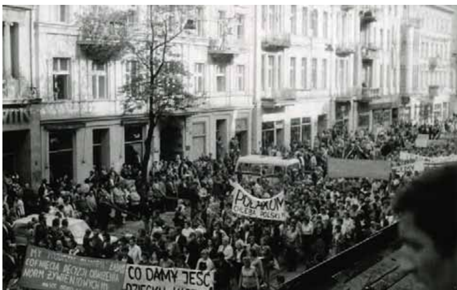
Marsz głodowy w Łodzi zorganizowany przez ZR NSZZ „Solidarność” Ziemi Łódzkiej 30 lipca 1981 r.