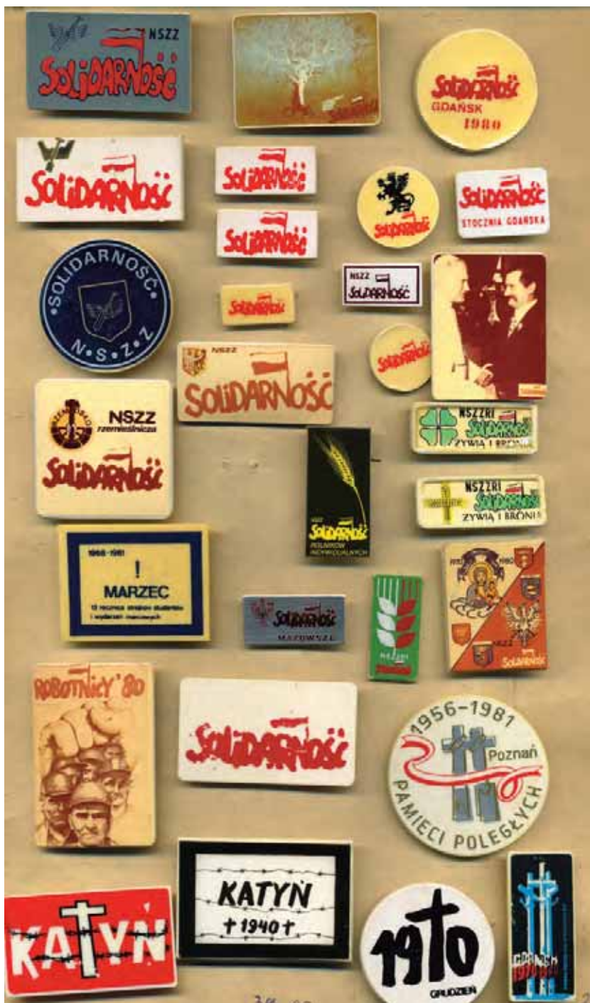
Fragment kolekcji Zenona Szendo – działacza opozycji antykomunistycznej w regionie łódzkim