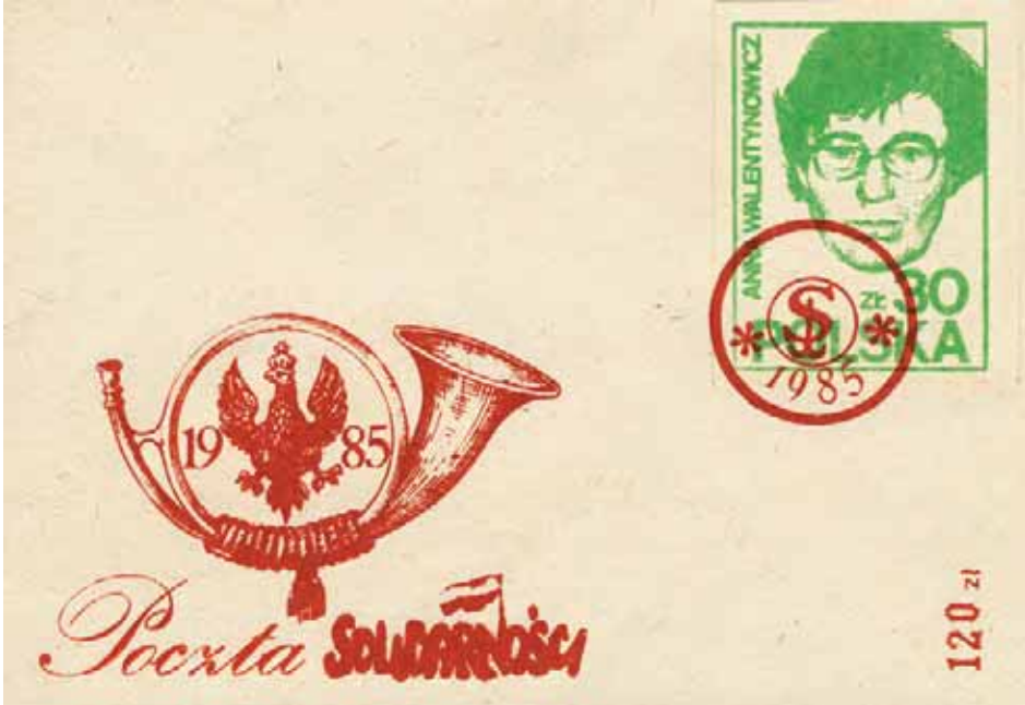
Fragment kolekcji Zenona Szendo – działacza opozycji antykomunistycznej w regionie łódzkim (AIPN Łd, 237/19)