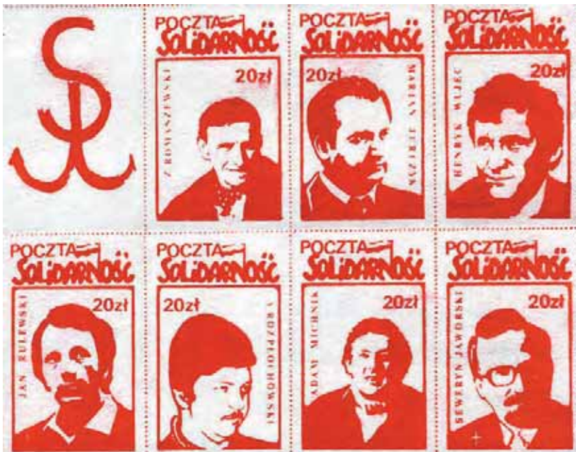
Fragment kolekcji Zenona Szendo – działacza opozycji antykomunistycznej w regionie łódzkim (AIPN Łd, 237/19)