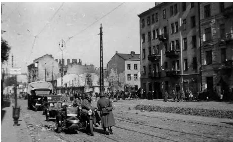
Pojazdy jednostki policji niemieckiej wkraczającej do Warszawy zaraz po kapitulacji miasta na ulicy Okopowej – widok z rogu ulic Okopowej i Chłodnej.