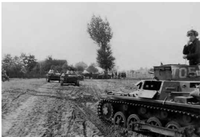
Czołgi niemieckie z 4. Dywizji Pancernej na drodze podczas walk we wrześniu 1939 r. o Kamion koło Wyszogrodu. Zdjęcie ze zbiorów NARA (AIPN, 2196/78/1)