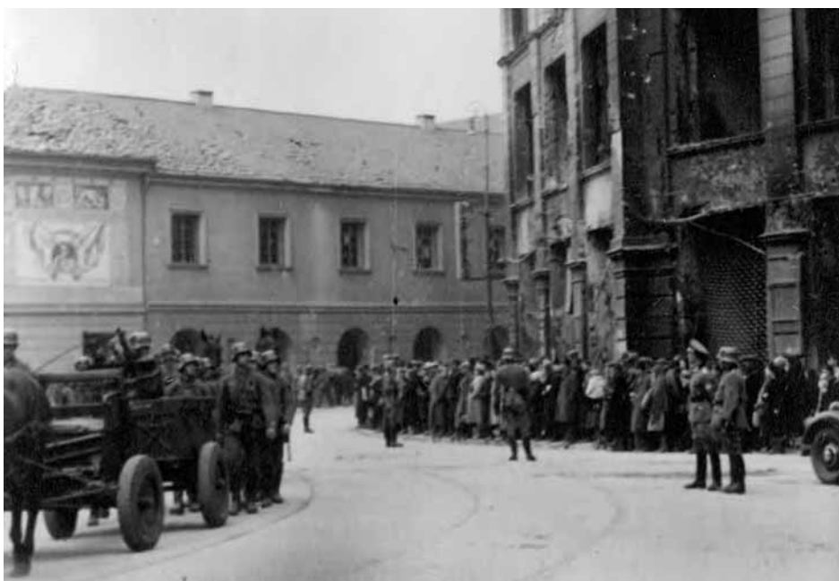
Wkraczający do Warszawy oddział wojsk niemieckich skręca w ulicę Bielańską – widok z rogu ulic Bielańskiej i Długiej. Zdjęcie z kolekcji funkcjonariusza policji niemieckiej (AIPN, 2329/1/4)