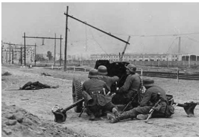
Niemieckie działo przeciwpancerne Pak 36 ostrzeliwuje polskie pozycje podczas niemieckiego natarcia na podwarszawskie Włochy. Zdjęcie ze zbiorów NARA (AIPN, 2196/119/24)