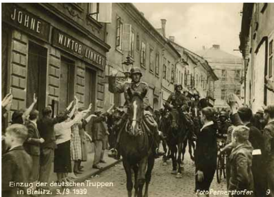
Żołnierze Wehrmacht wkraczają 3 września 1939 r. do Bielska witani przez niemieckich mieszkańców miasta. Zdjęcie z niemieckiego albumu „Bielitz. Unsere Heimat ist wieder Deutsch” (AIPN, Zbiór fotografii GK, nr inw. 22118)