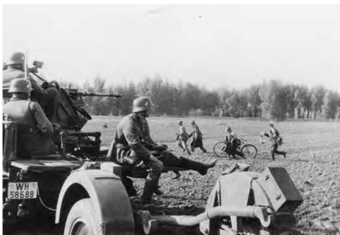
Niemieckie samobieżne działo przeciwlotnicze Sd.Kfz. 10/4 z 4. Dywizji Pancernej podczas walk o Kamion koło Wyszogrodu.