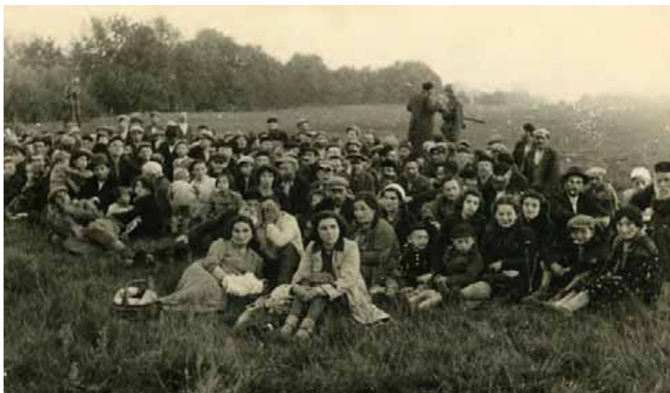
Spędzeni przez Niemców Żydzi z Przedborza. Autor nieznany, zdjęcie niemieckie znalezione w 1945 r. w poniemieckim domu w Sosnowcu (AIPN, Zbiór fotografii GK, nr inw. 19447)