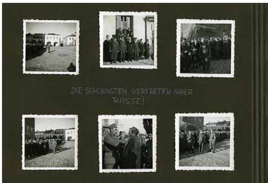
Karta nr 38 z albumu Ottmara Kreisela podpisana „Najpiękniejsi przedstawiciele swojej rasy!”. Na zdjęciach widać represje niemieckie w stosunku do ludności żydowskiej w nieustalonym polskim mieście