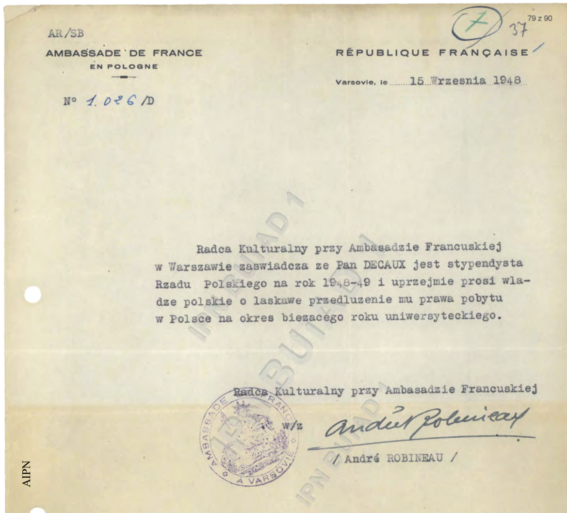
Pismo popierające prośbę Étienne'a Decaux o przedłużenie pobytu w Polsce, 15 IX 1948 r. (IPN BU 1218/10225)