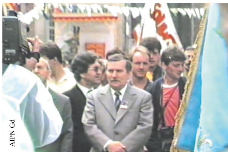
Procesja Bożego Ciała w Gdańsku w dniu 2 VI 1988 r. (IPN Gd 334/16)