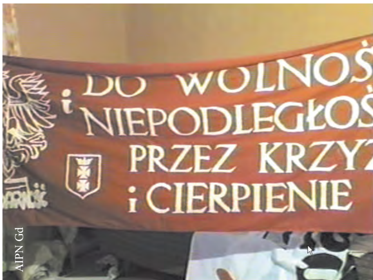
Transparent ujawniony w mieszkaniu Barbary Hejcz w Gdańsku w 1986 r. (IPN Gd 334/2)