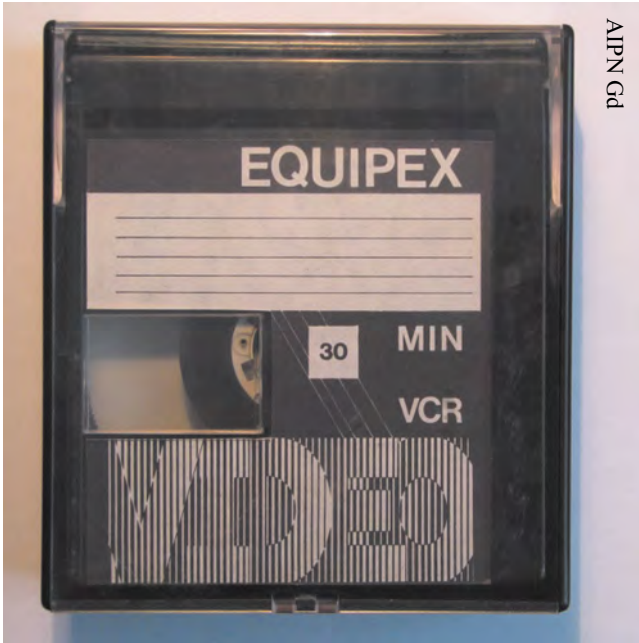
Kaseta Sony V-60 H