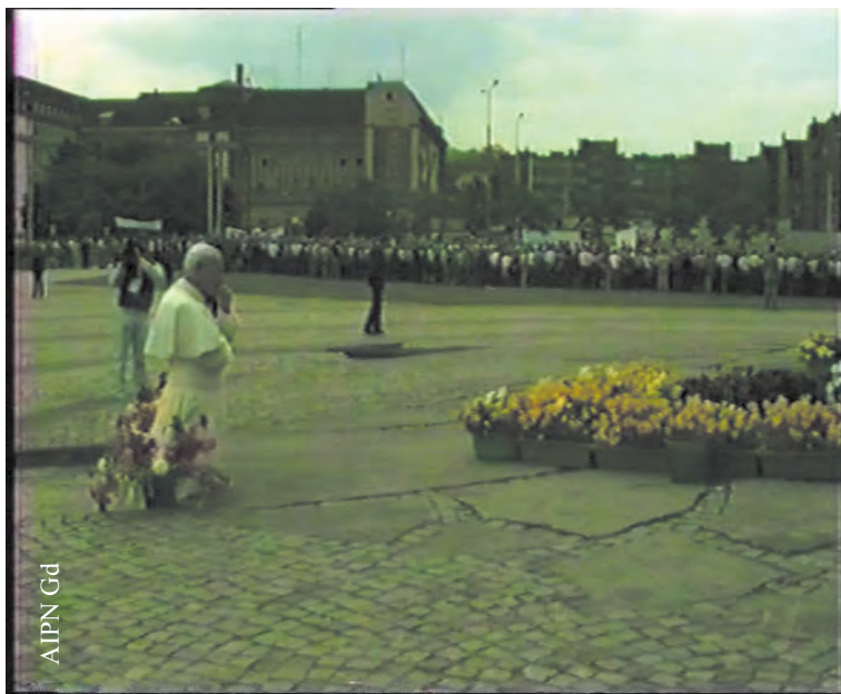
Papież Jan Paweł II pod pomnikiem Poległych Stoczniovców w Gdańsku w dniu 12 VI 1987 r., w tle funkcjonariusze SB odwrócenii plecami (IPN Gd 334/7)