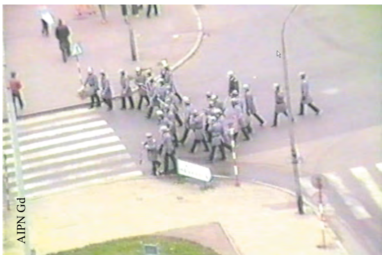
Oddział ZOMO na skrzyżowaniu ul. Rajskiej i ul. Heweliusza w Gdańsku, b.d.