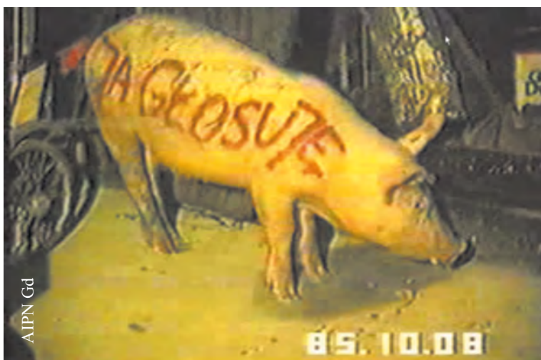
Świnia z napisem „Ja głosuję”, przewożona w samochodzie zatrzymanym w Gdyni-Orłowie w 1985 r. (IPN Gd 334/18)