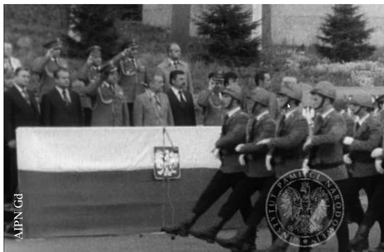
Obchody 35-lecia MO i SB w koszarach ZOMO w Gdańsku w dniu 17 X 1979 r. (IPN Gd 334/29)