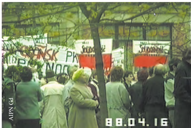
Pochód organizacji opozycyjnych z okazji rocznicy zbrodni katyńskiej na ul. Rajskiej w Gdańsku w dniu 16 IV 1988 r. (IPN Gd 334/20)