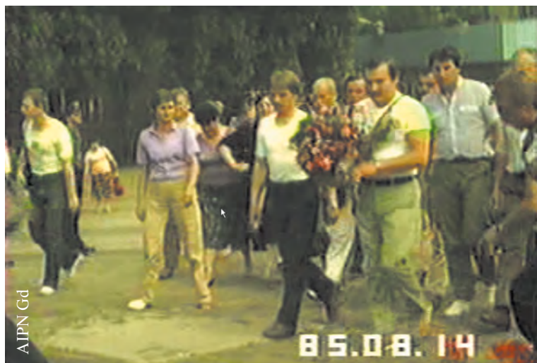
Składanie kwiatów pod pomnikiem Poległych Stoczniovców w Gdańsku w dniu 14 VIII 1985 r., z kwiatami Lech Wałęsa (IPN Gd 334/1)