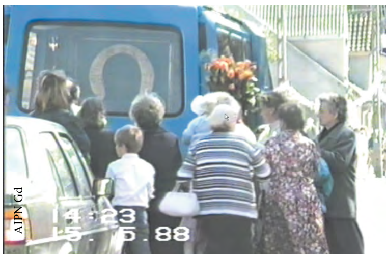
Pożegnanie peregrynującego obrazu Matki Boskiej Częstochowskiej przez mieszkańców Gdańska w dniu 15 V 1988 r. (IPN Gd 334/16)