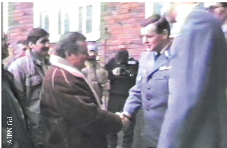
Lech Wałęsa podczas spotkania z funkcjonariuszami WUSW w budynku WUSW w Gdańsku na Biskupiej Górze w dniu 14 II 1990 r. (IPN Gd 334/26)