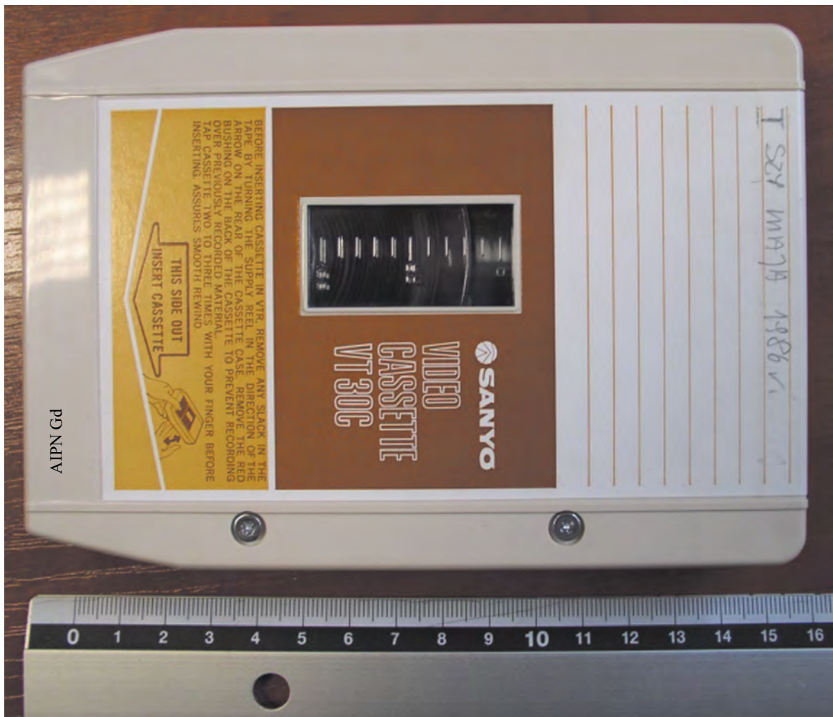
Kaseta Sanyo VT-30 C