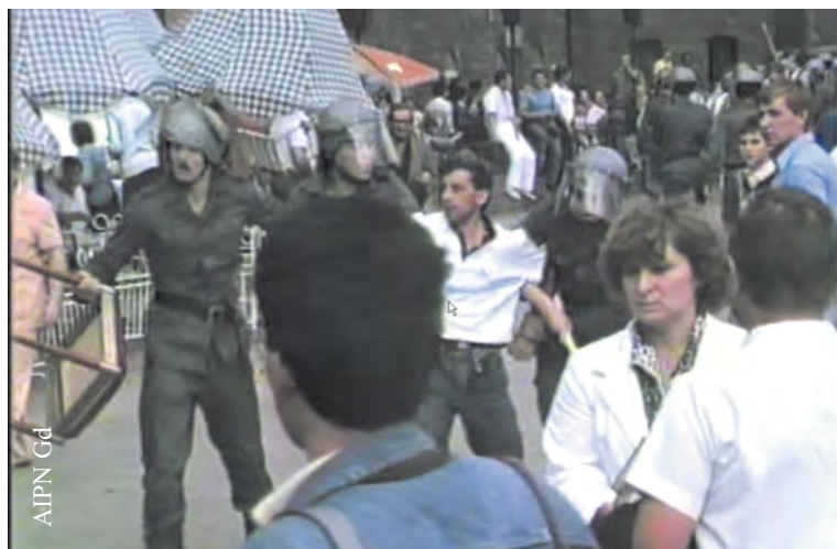
Uczestnicy demonstracji w Gdańsku w dniu 14 VIII 1988 r. zatrzymywani przez ZOMO