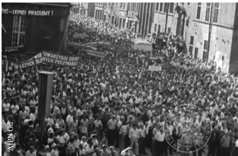
Wiec poparcia dla polityki PZPR i Edwarda Gierka w Gdańsku w dniu 28 VI 1976 r.