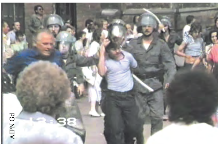
Uczestnicy demonstracji w Gdańsku w dniu 14 VIII 1988 r. zatrzymywani przez ZOMO (IPN Gd 334/11)