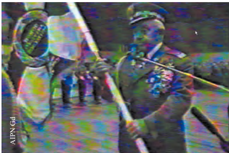
Szef WUSW w Gdańsku gen. Jerzy Andrzejewski podczas przekazywania sztandaru