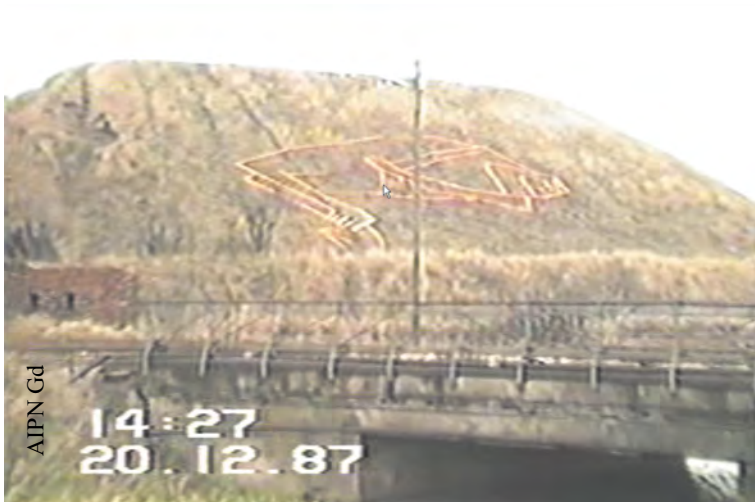
Postać ks. Jerzego Popiełuszki ułożona z desek na stokach Bastionu Żubr w Gdańsku w dniu 20 XII 1987 r. (IPN Gd 334/18)