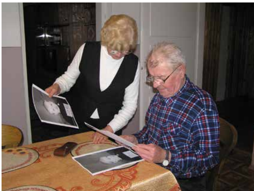
Świadkowie niemieckiej akcji badawczej realizowanej przez SRV IDO w Szaflarach w 1942 r. rozpoznają swoje zdjęcia z dzieciństwa, Szaflary, 2011 r.