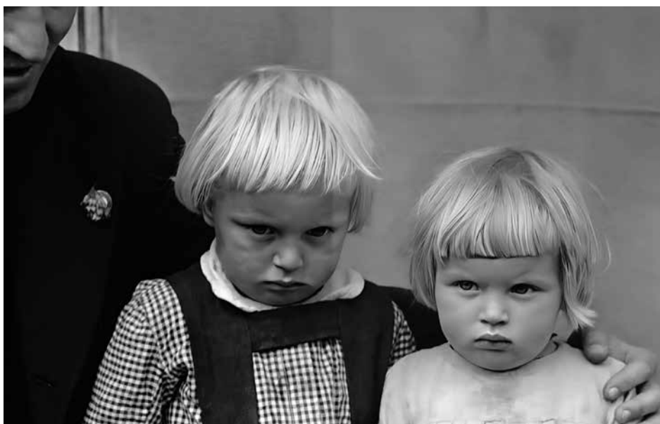
Fotografia dzieci z Kościeliska. Z boku widoczna postać austriackiego antropologa dr. Antona Plügla, koordynatora pilotażowych badań antropologicznych i ludoznawczych realizowanych na Podhalu w 1940 r.