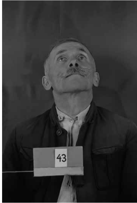
Fotografie mieszkańców Szaflar wykonane podczas badań antropologicznych realizowanych przez SRV IDO w Szaflarach latem 1942 r. Tego typu zdjęcia stanowiły załącznik do ankiet rasowych z danymi z pomiarów antropometrycznych.