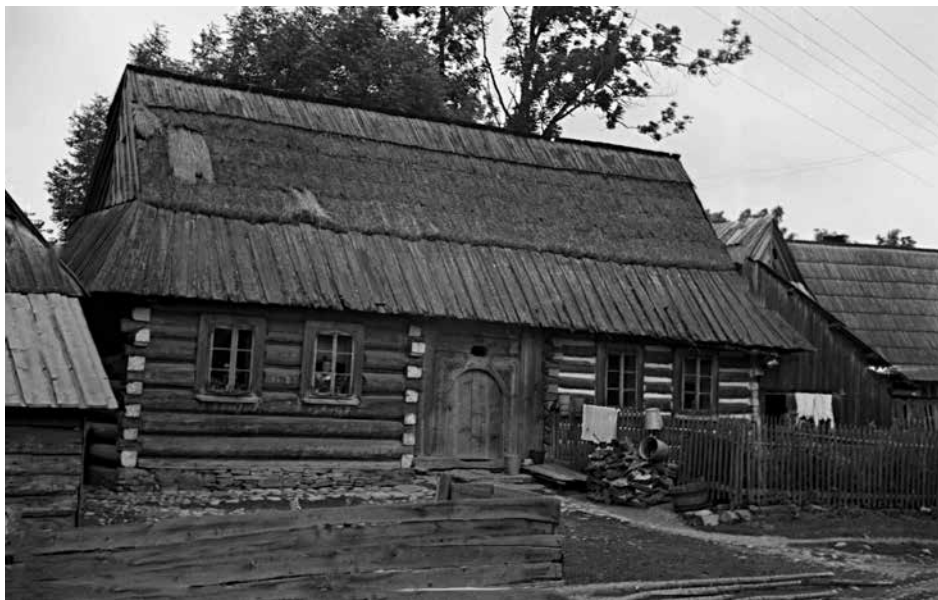
Fragment wiejskiej zabudowy w miejscowości Szafflary. Tradycyjny drewniany dom podhalański. Zdjęcie wykonane podczas etnograficznych badań terenowych kierowanych przez dr Ingebord Sydow, Szafflary, 1942 r. AUJ, SRV-IDO, Box 70