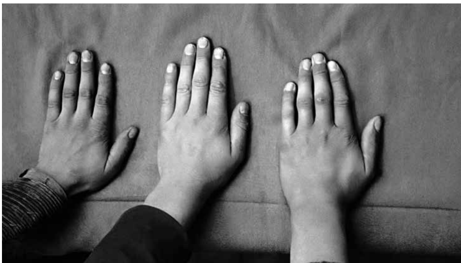
Fotografia dłoni uczniów Szkoły Przemysłu Drzewnego w Zakopanem, przemianowanej w czasie wojny przez niemieckie władze okupacyjne na Berufsfachschule für Goralische Volkskunst. Zdjęcie wykonane podczas pilotażowych badań antropologicznych prowadzonych na Podhalu przez funkcjonariuszy rządu GG w 1940 r.