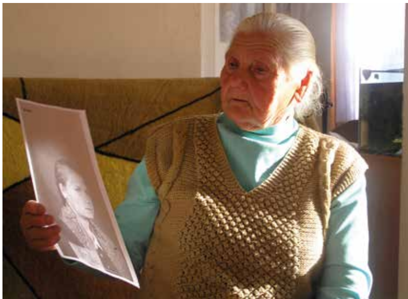
Mieszkanca Szaflar podczas wywiadu etnograficznego patrzy na swoje zdjęcie z młodości wykonane przez niemieckich antropologów w 1942 r., Szaflary, 2008 r.