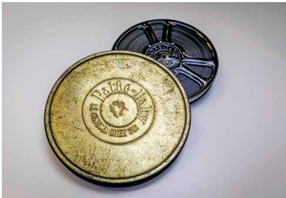
Taśma filmowa marki Pathé-Baby (9,5 mm) z niemieckim filmem propagandowym z okresu II wojny światowej.