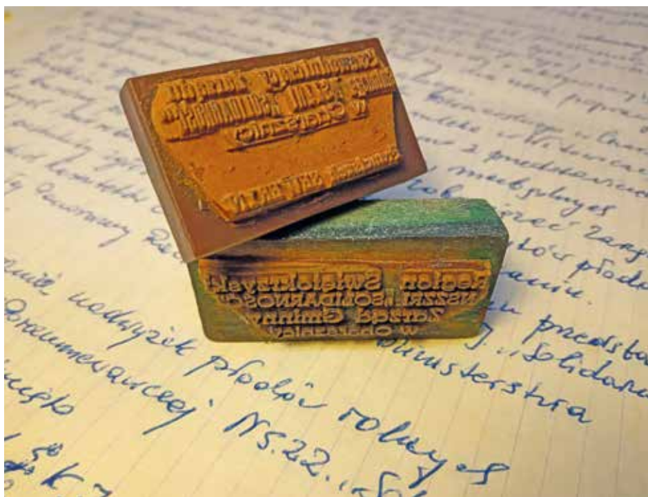
Pieczone przekazane wraz z dokumentacją ZG NSZZ RI „Solidarność” w Charsznicy. AIPN Kr, 696/2

najcenniejszym nabytkiem jest dziennik lotów (Royal Air Force Pilot's flying log book) z lat 1940–1942 16 . Odnajdziemy tu także wiele innych interesujących materiałów: legitymację Aeroklubu Rzeczypospolitej Polskiej z 1935 r., świadectwo ukończenia kursu podchorążych rezerwy lotnictwa z 1936 r., świadectwo ukończenia kursu pilotażu z 1936 r., legitymację obcokrajowca pełniącego służbę w lotnictwie z 1941 r. czy wreszcie fotografię ze spotkania z gen. Władysławem Sikorskim w Exeter w 1942 r. 17 Całość uzupełniają dokumenty dotyczące studiów medycznych Mieczysława Pietrzyka na Uniwersytecie Edynburskim oraz na Uniwersytecie Jagiellońskim w Krakowie 18 .