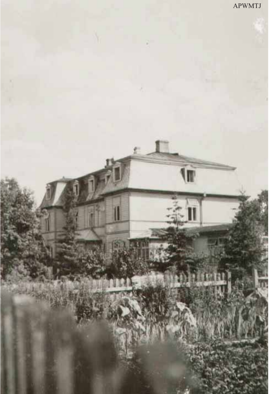
Dom zakonny jezuitów (trzeciej probacji) w Otwocku (1942 r.)