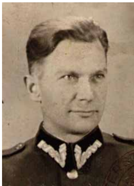
Stanisław Mrożek (AIPN Bi, 337/6)