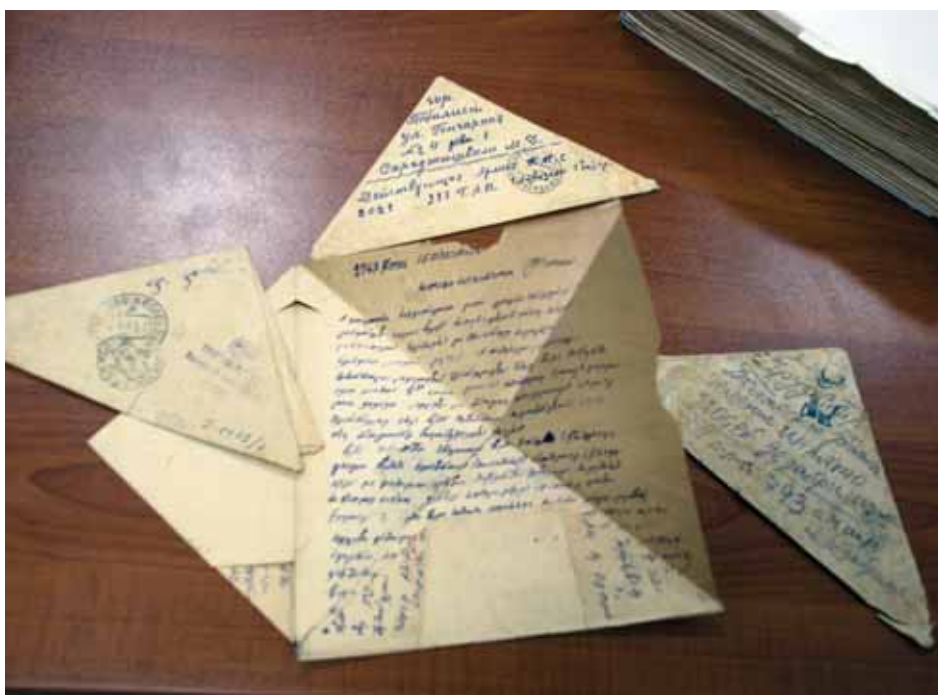
List z frontu II wojny światowej