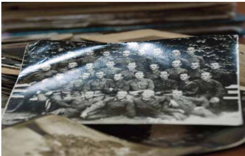
Fotografia pracowników NKWD

Key words: Archives of the Ministry of Internal Affairs of Georgia, Archives of the State Security of Georgia, Archives of the Soviet Police of Georgia, Archives of the Communist Party of the Georgian Soviet Socialist Republic.