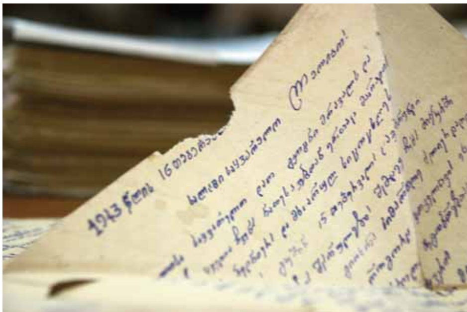
List z miejsca przesiedlenia