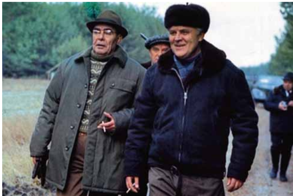
L. Breżniew i W. Szcerbyčkyj podczas polowania pod Kijowem (1976 r.)