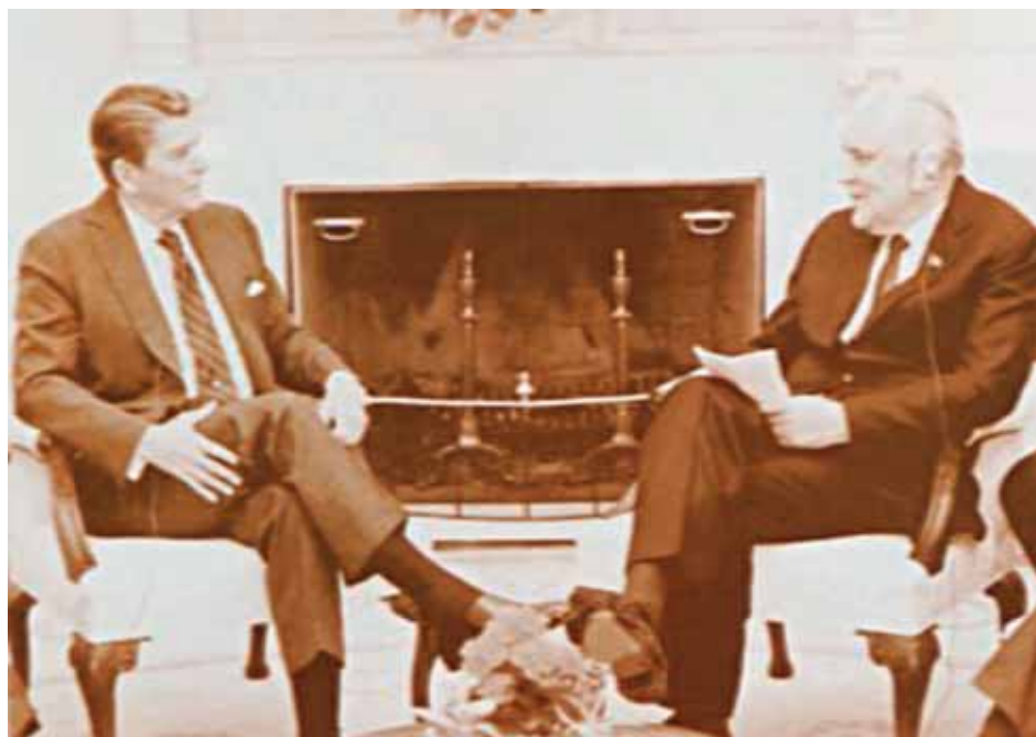
Spotkanie R. Reagana i W. Szcerbyčkiego (Waszyngton, 1985 r.)