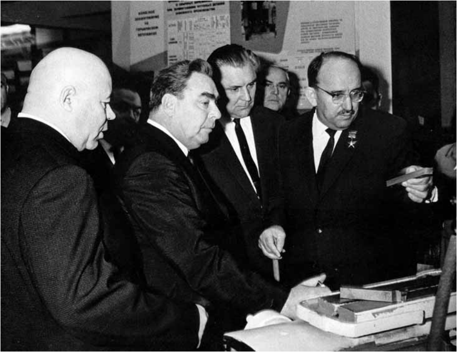
Od lewej: P. Szelest, L. Breżniew i W. Szerbykyj (lata sześćdziesiąte XX w.)