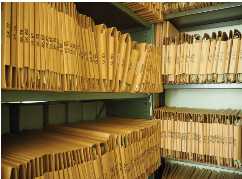
Archiwalia Oddziału VI Sztabu Naczelnego Wodza