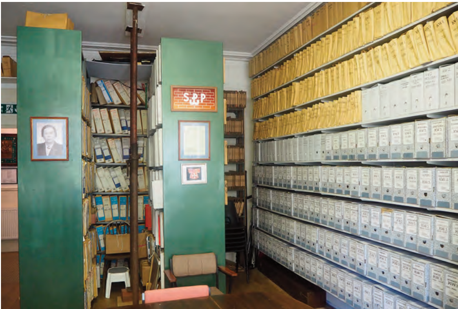
Pracownia naukowa im. Haliny Czarnockiej