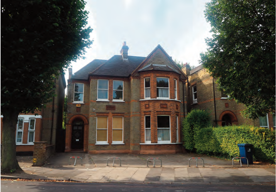
Studium Polski Podziemnej w Londynie – widok współczesny