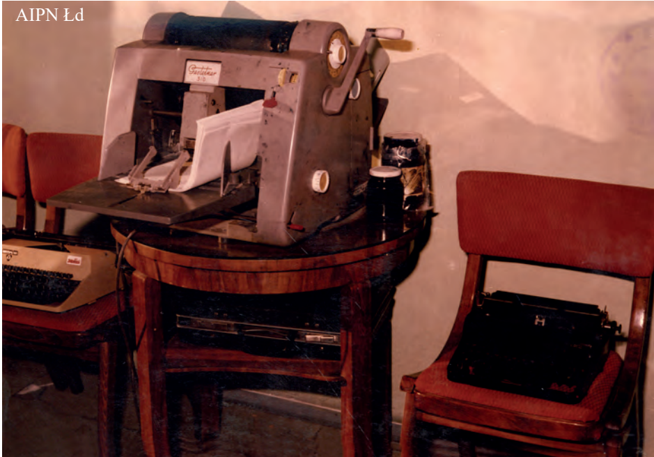
Fotografia maszyn do pisania oraz powielacza zakwestionowanych podczas przeszukań przeprowadzonych 22 III 1982 r. u Władysławy Latosińskiej, Zygmunta Augustyniaka i Janiny Wędrychowicz. AIPN Łd, 50/1, t. 3

nie odstąpił od udziału w takiej działalności przez to, że uczestniczył w zebraniach, które wymienieni organizowali i na których redagowali, a następnie powielali i kolportowali ulotki zawierające fałszywe wiadomości o treści antypaństwowej, nawołujące do nieprzestrzegania rygorów stanu wojennego, przy czym wiadomości te mogły wywołać niepokój publiczny bądź rozruchy, i za to z mocy art. 46 ust. 1 i art. 48 ust. 2, 3 i 4 Dekretu z dnia 12 grudnia 1981 r. o stanie wojennym (DzU, nr 29, poz. 154) w zw[iązku] z art. 10 § 2 [kk] 10 , przyjmując za podstawę wymiaru kary art. 48 ust. 4 cytowanego dekretu w związku z art. 10 § 3 kk 11 , skazał go na karę 2 (dwóch) lat pozbawienia wolności.