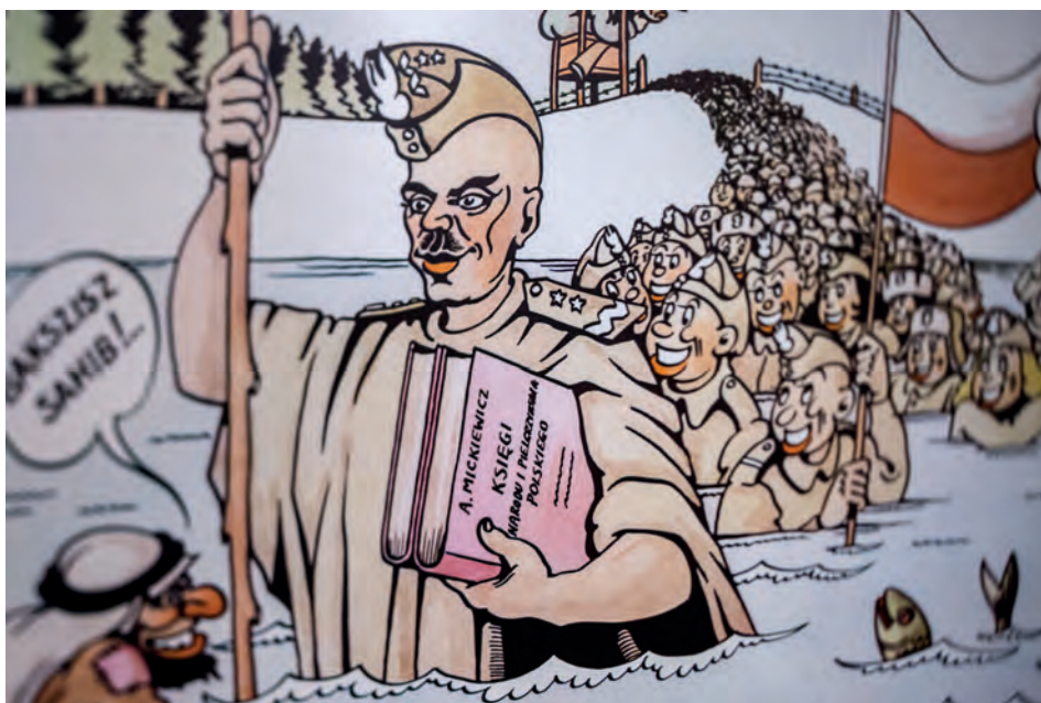
Jedna z prac Mieczysława Kuczyńskiego prezentowana na wystawie, Londyn, 21 VII 2019 r.

Wrażenia z wystawy można było odnotować w książce pamiątkowej, z czego goście chętnie korzystali. Zamieszczone wpisy świadczą, że zarówno ekspozycja, jak i cała uroczystość bardzo się podobała. Zwrócono uwagę na nietypowy sposób przedstawienia losów II Korpusu Polskiego, który przemawia tak do starszego, jak i młodego pokolenia, możliwość poznania dziejów tej formacji z innej perspektywy – jej zabawny, ale i edukacyjny charakter. Wystawę można było oglądać do 1 sierpnia br.