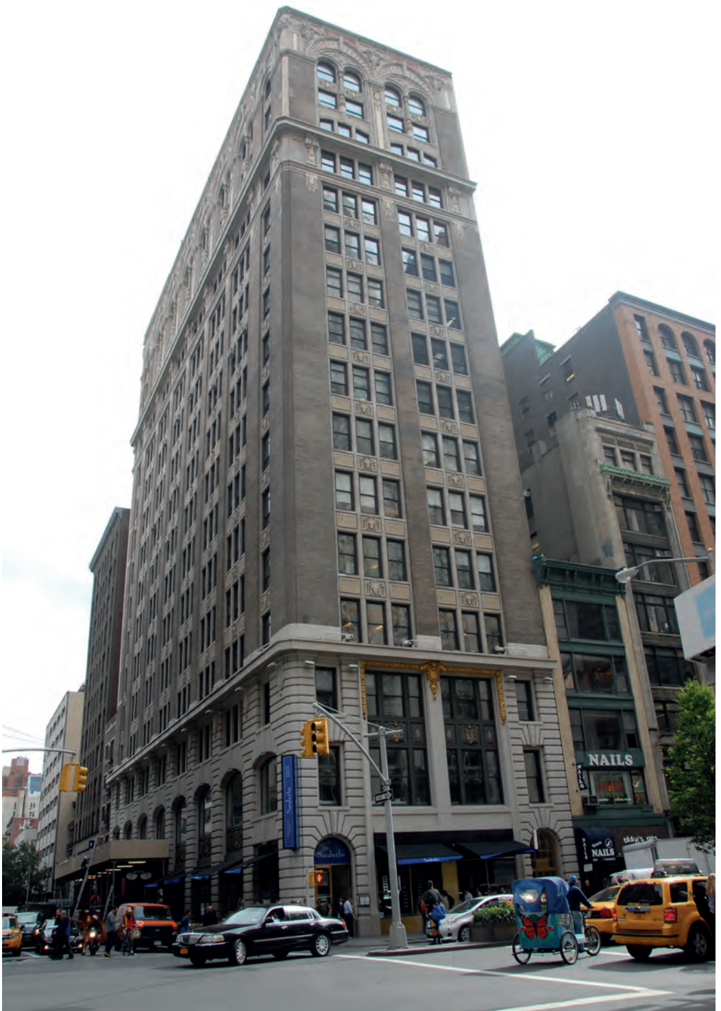
Budynek przy 381 Park Avenue South w Nowym Jorku, w którym mieściła się trzecia i czwarta siedziba Instytutu Józefa Piłsudskiego w Ameryce (widok współczesny).