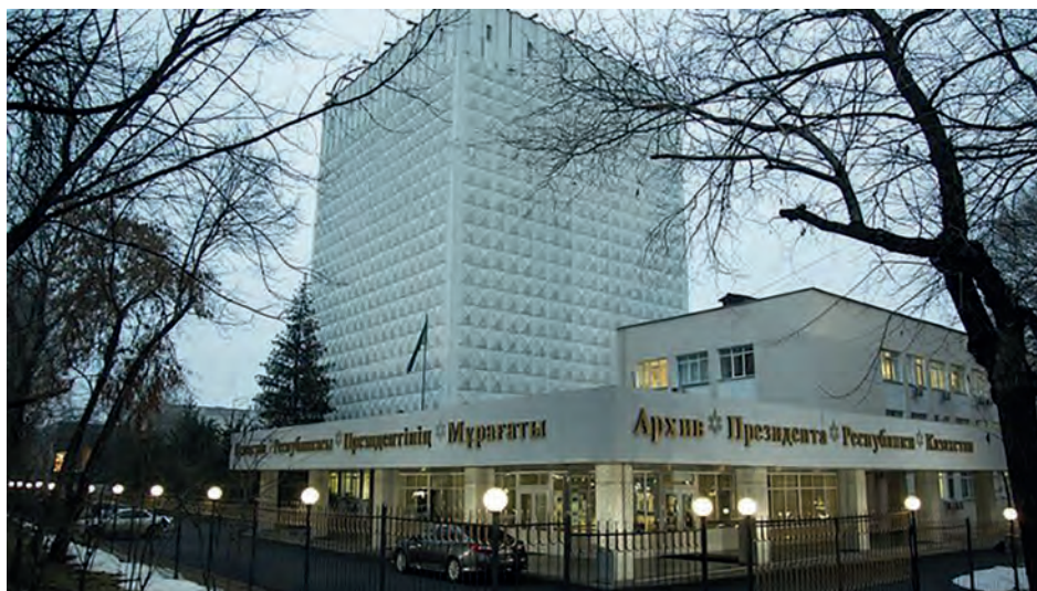
Archiwum Prezydenta Republiki Kazachstanu w Almaty, 2018 r.

Zainteresowanie badaczy dokumentami z Archiwum Prezydenta rośnie z każdym rokiem 77 . Studia nad komunistycznym okresem historii Kazachstanu z pominięciem dokumentów Archiwum nie byłyby możliwe, ponieważ jest ono jedynym cesjonariuszem dokumentów partyjnych władzy sowieckiej. Źródła z pierwszej połowy XX w., w tym materiały archiwalne o charakterze epistolarnym, oraz wszelkie zagadnienia związane z wprowadzeniem władzy sowieckiej w Kazachstanie i wojną domową lat 1918–1920, nie przestają wzbudzać powszechnego zainteresowania badaczy.