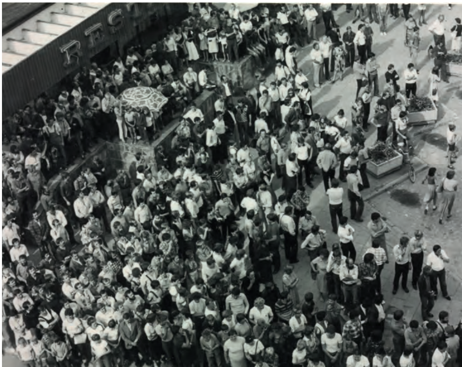
„Nielegalne zgromadzenie” na pl. Wolności (przed restauracją „Ratuszowa”) w Lubinie, 31 VIII 1982 r.

komentarzy, a także ustał nabór do MO. Złagodzeniu nastrojów społecznych miało służyć zmniejszenie dystansu między funkcjonariuszami a mieszkańcami Lubina, m.in. poprzez przekonywanie ich do słuszności swoich działań, obalenie mitu niewinnych ludzi zamordowanych lub ranionych oraz zakończenie śledztw prowadzonych przeciwko osobom aresztowanym.