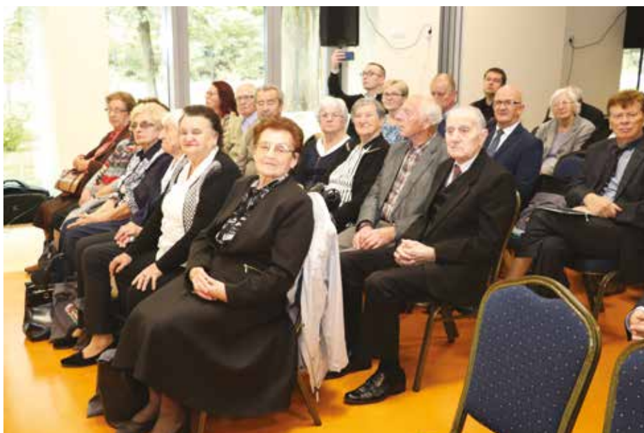
Byli więźniowie Fortu III.