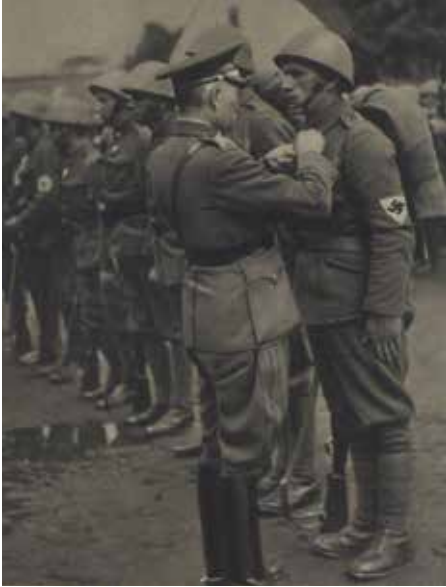
Naczelny Wódz Armii Słowackiej i minister obrony narodowej gen. Ferdinand Čatloš w trakcie odznaczania żołnierzy słowackich narodowości niemieckiej po zakończonej kampanii w Polsce. „Nový Svet”, 7 X 1939