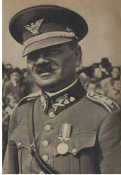
Dowódca 1. Dywizji Piechoty gen. Antonín Pulanich po zakończeniu kampanii w Polsce jesienią 1939 r. „Nový Svet”, 7 X 1939

O ile większość jednostek słowackich została przewidziana do zabezpieczania zaplecza mających wkroczyć do Polski oddziałów niemieckich oraz do ochrony granicy słowacko-polskiej przed ewentualnymi działaniami Wojska Polskiego, o tyle Dywizja „Jánošík” dowodzona przez gen. Antonína Pulanicha 8 otrzymała rozkaz wkroczenia na terytorium Polski i aktywnego wspierania natarcia niemieckiego na Podhalu i w Beskidach. Fakt jej wykorzystania poza granicami Republiki Słowackiej jest bezsprzeczny, jednakże kontrowersje wzbudzają okoliczności, czas i tryb podjęcia decyzji o zaangażowaniu dywizji w działania ofensywne. Pewne światło na te wydarzenia rzucają zapisy w odnalezionym dzienniku.