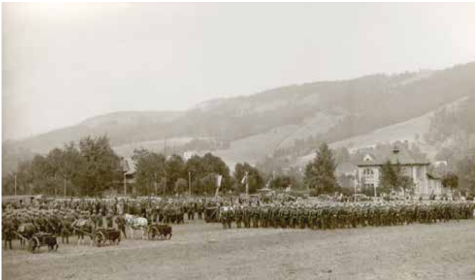
Uroczystość uhonorowania żołnierzy słowackich w Zakopanem, 21 IX 1939 r. VHA Bratislava