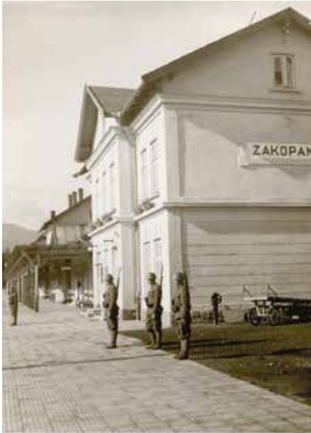
Żołnierze 1. batalionu 4. pułku piechoty 1. Dywizji Piechoty podczas warty na stacji kolejowej w okupowanym Zakopanem, wrzesień 1939 r.