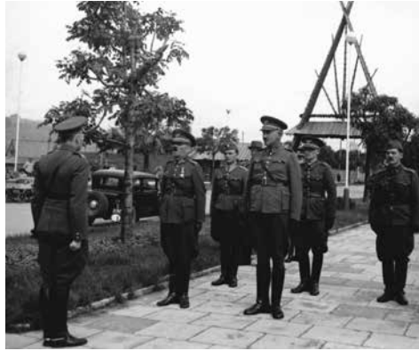
Naczelnny Wódz Armii Słowackiej gen. Ferdinand Čatloš (z lewej, stoi tyłem) podczas odbierania meldunku od dowódcy 1. Dywizji Piechoty gen. Antonína Pulanicha (drugi od lewej), Zakopane, 21 IX 1939 r.