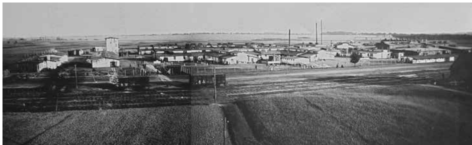
Obóz internowanych żołnierzy Armii URL w Kaliszu (widok ogólny), 1922 r. Ukraińska Stanica w Kaliszu (Polska): kolekcja zdjęć Rity Deszko (USA), Biblioteka Ukraińska im. Symona Petlury w Paryżu, 29.1.P-1

Staraniem ukraińskich władz wojskowych i polskiej administracji obozu zorganizowano dostęp do opieki medycznej, którą kozakom i oficerom zapewniał szpital obozowy