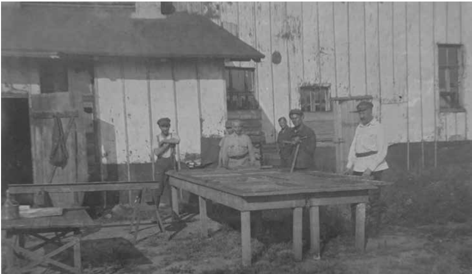
Ukraińscy żołnierze przed budynkiem warsztatów, Kalisz, 1924–1925. Ukraińska Stanica w Kaliszu (Polska): kolekcja zdjęć Rity Deszko (USA), Biblioteka Ukraińska im. Symona Petlury w Paryżu, 29.1.P-37

Wiosną 1922 r. polskie władze kontynuowały politykę zatrudniania internowanych do prac rolnych w prywatnych gospodarstwach oraz do prac pomocniczych w polskich jednostkach wojskowych i instytucjach publicznych. Z mieszkańców obozów tworzone oddziały robocze (zespoły), które zazwyczaj zachowywały swoją organizację wojskową. Dowództwo Armii URL robiło wszystko, by te zespoły oraz ci członkowie oddziałów,