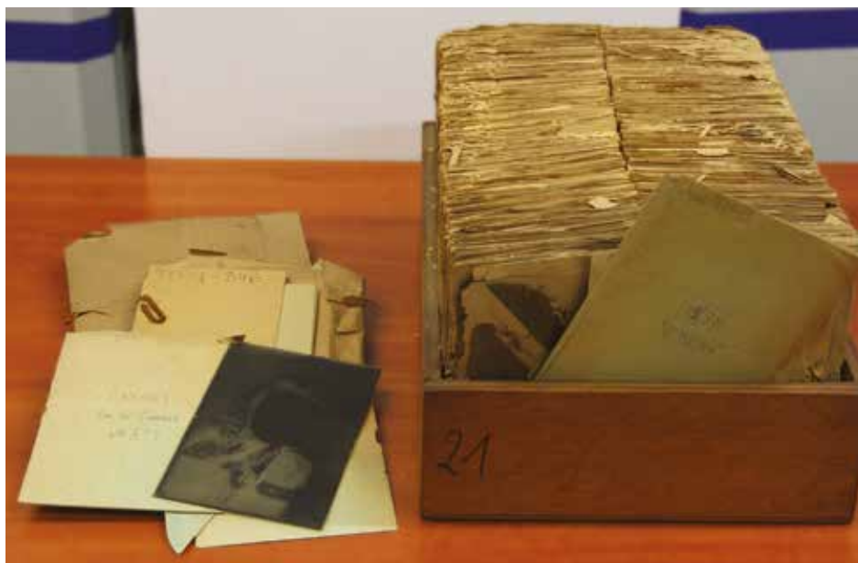
Kliske negatywowe z kolekcji po krakowskich zakładach fotograficznych (stan odziedziczony po aktotwórcy). Widoczne rezultaty nieprawidłowego przechowywania materiałów przed ich przejęciem przez GKBZpNP i nieprzeprowadzenia przez nią konserwacji, Warszawa, 2015 r.