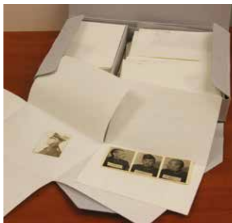
Przykład sposobu zabezpieczania zdjęć luźnych – fotografie umieszczone w osobnych obwolutach z papieru bezkwasowego, Warszawa, 2015 r.