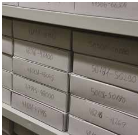
Podła do przechowywania zdjęć luźnych ze zbioru fotografii GKBZpNP (stan obecny), Warszawa, 2015 r.

Podobnie jak w przypadku innych materiałów archiwalnych, przyjęto zasadę udostępniania jedynie kopii cyfrowych fotografii ze zbioru, a tylko w nielicznych, uzasadnionych przypadkach – oryginałów. Digitalizacja i udostępnianie kopii pozwala znacznie