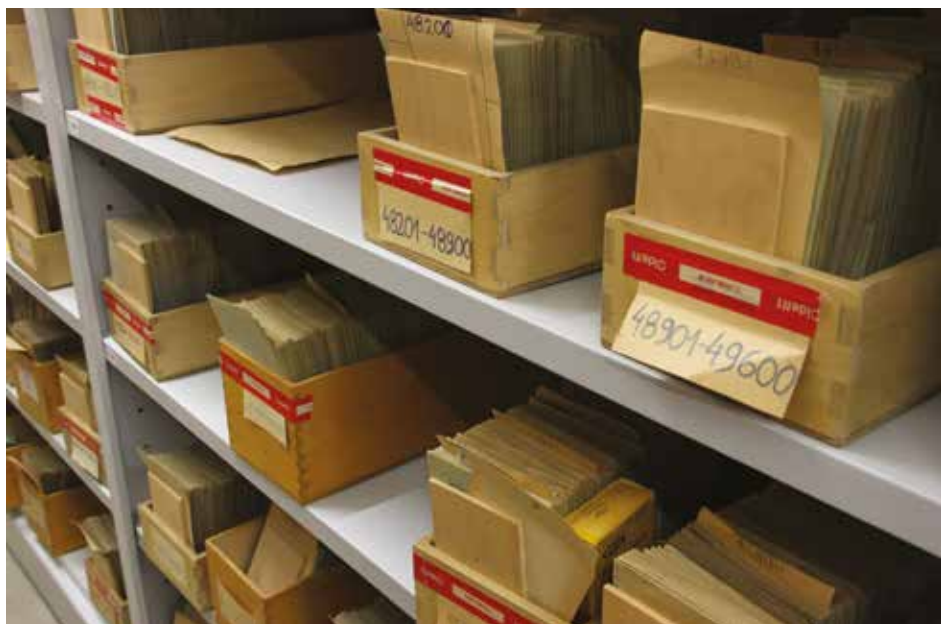
Skrzynki zbioru negatywów (stan odziedziczony po aktotwórcy), Warszawa, 2015 r.