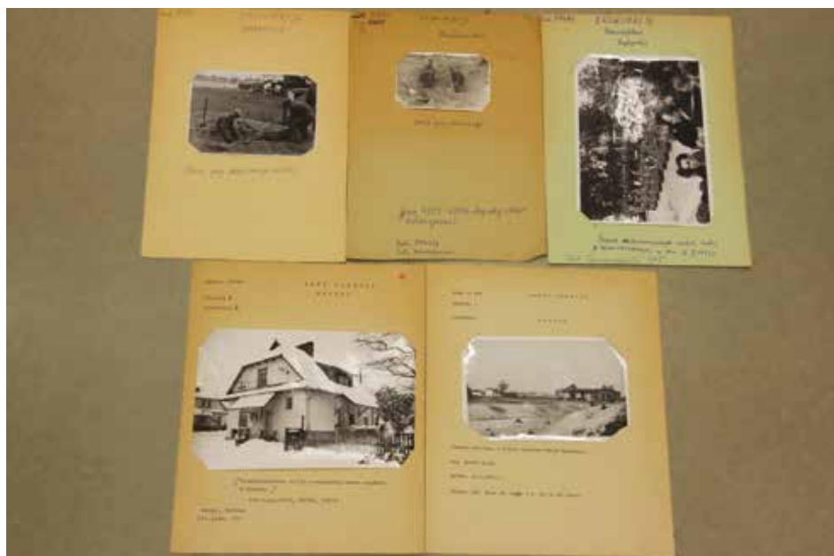
Przykłady kart zabezpieczających ze zdjęciami luźnymi. Widoczne różnice w sposobie sporządzania opisów, Warszawa, 2015 r.