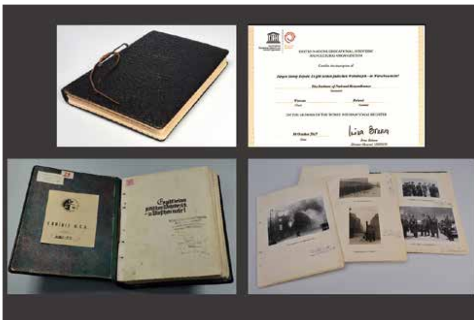
Raport Jürgena Stroopa (AIPN, 2972/34) oraz certyfikat o wpisaniu obiektu na listę UNESCO „Pamięć Świata”.