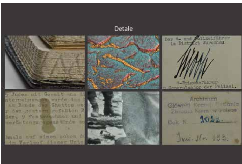
Raport Jürgena Stroopa (AIPN, 2972/34) – detale dokumentu.