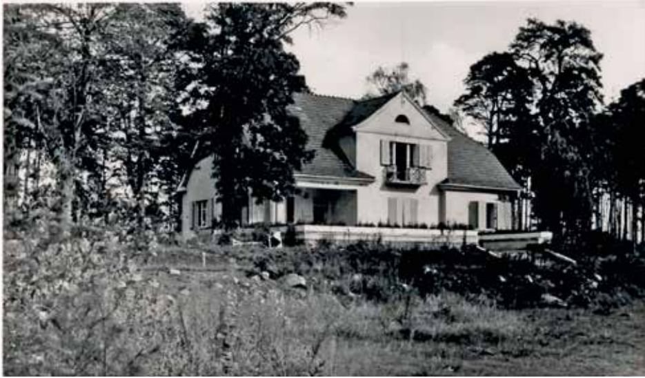
Dom komendanta KL Stutthof, październik 1945 r. AIPN, GK 2972/84

Od 1 grudnia 1928 r. do 1 maja 1930 r. należał do Sturmabteilungen. Od 1 grudnia 1928 r. był członkiem NSDAP (numer partyjny 106 204), a od 1 maja 1930 r. – SS (numer ewidencyjny 5448), z przydziałem do 4. Chorągwi Allgemeine-SS „Schleswig-Holstein” w Hamburgu-Altonie. Od 24 grudnia 1932 r. do 1 kwietnia 1936 r. był dowódcą I batalionu 53. Chorągwi Allgemeine-SS „Dithmarschen” w Heide w Szlezwiku-Holsztynie, a następnie przeniesiono go do 56. Chorągwi Allgemeine-SS „Franken” w Bambergu w bawarskiej Górnej Frankonii. Między 1 grudnia 1936 r. a 1 lutego 1937 r. dowodził 36. Chorągwią Allgemeine-SS na terenie Wolnego Miasta Gdańska, a następnie został przeniesiony na takie samo stanowisko w tym mieście – do 71. Chorągwi Allgemeine-SS, które zajmował do 8 maja 1945 r. Od 20 maja 1937 r. do 18 lipca 1937 r. oraz od 24 października 1938 r. do 22 grudnia 1938 r. odbywał ćwiczenia wojskowe w stopniu starszego szeregowego (Gefreiter) w 15. pułku piechoty Wehrmachtu (Infanterie-Regiment 15).