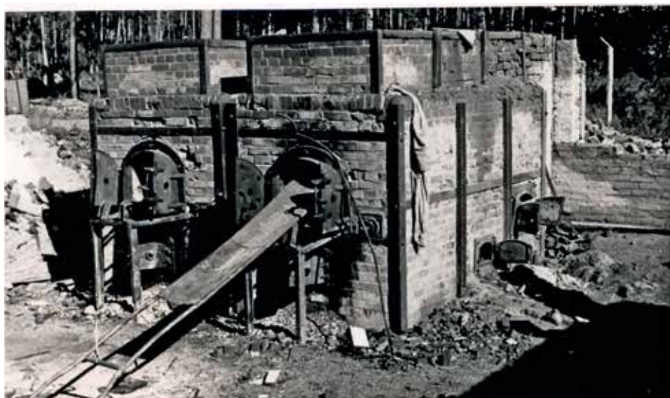
Piec krematoryjne w KL Stutthof, październik 1945 r.