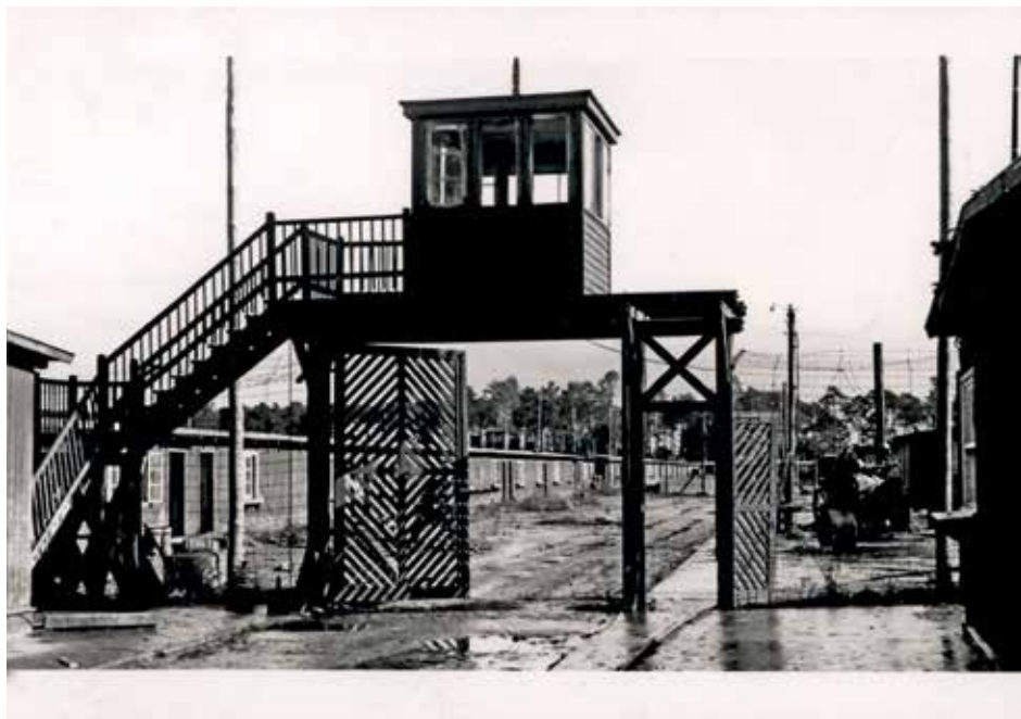
Brama wjazdowa do „starego obozu” w KL Stutthof, październik 1945 r. AIPN, GK 2972/84