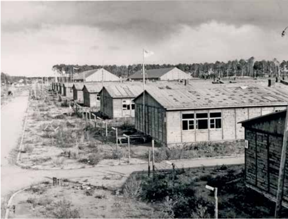
Baraki mieszkalne (bloki obozowe) dla więźniów w „nowym obozie” w KL Stutthof, październik 1945 r.

Na jego czele stał oficer SS, który jednak nie miał do pomocy – tak jak w niektórych obozach – stałych zastępców.