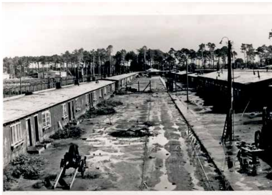
„Stary obóz” w KL Stutthof, październik 1945 r. AIPN, GK 2972/84