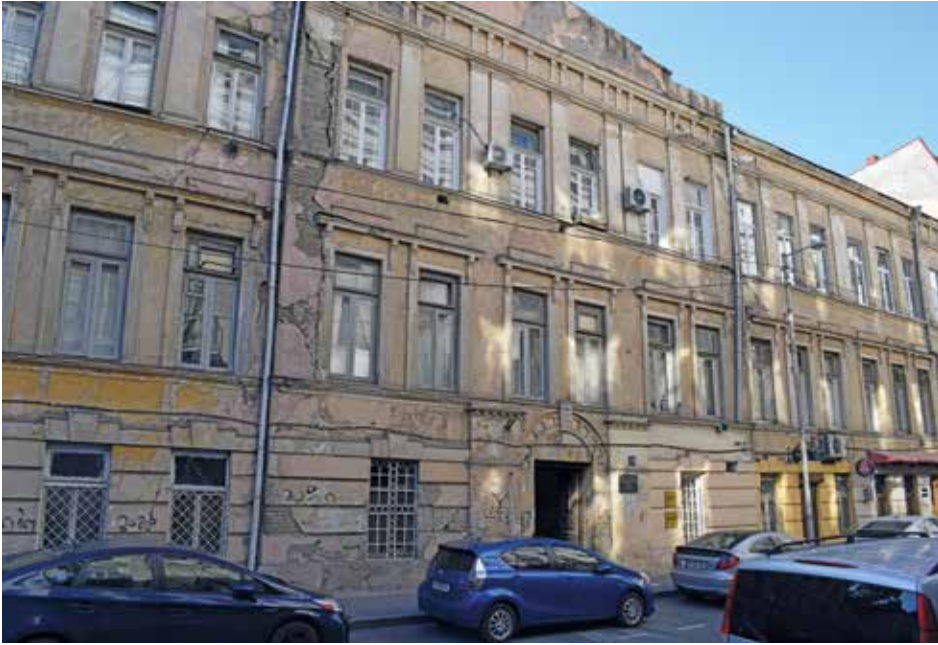
Dawny budynek NKWD przy ul. Ingorowka 22 w Tbilisi, miejsce przesłuchań osób aresztowanych w „operacji polskiej” 1937–1938.