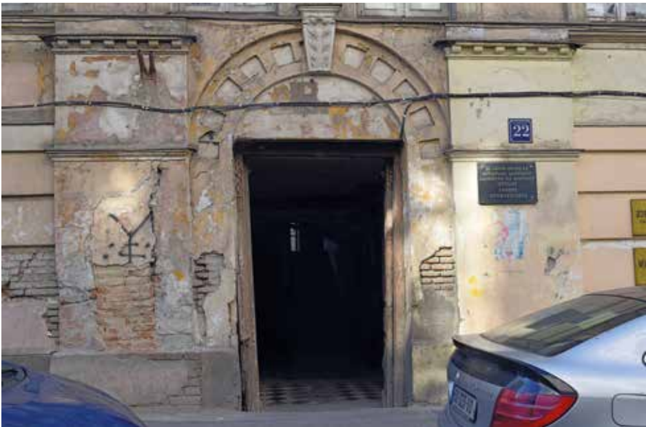
Wejście do dawnego budynku NKWD przy ul. Ingorowka 22 w Tbilisi. Fot. Stanisław Koller, 2019 r. Zbiory autora