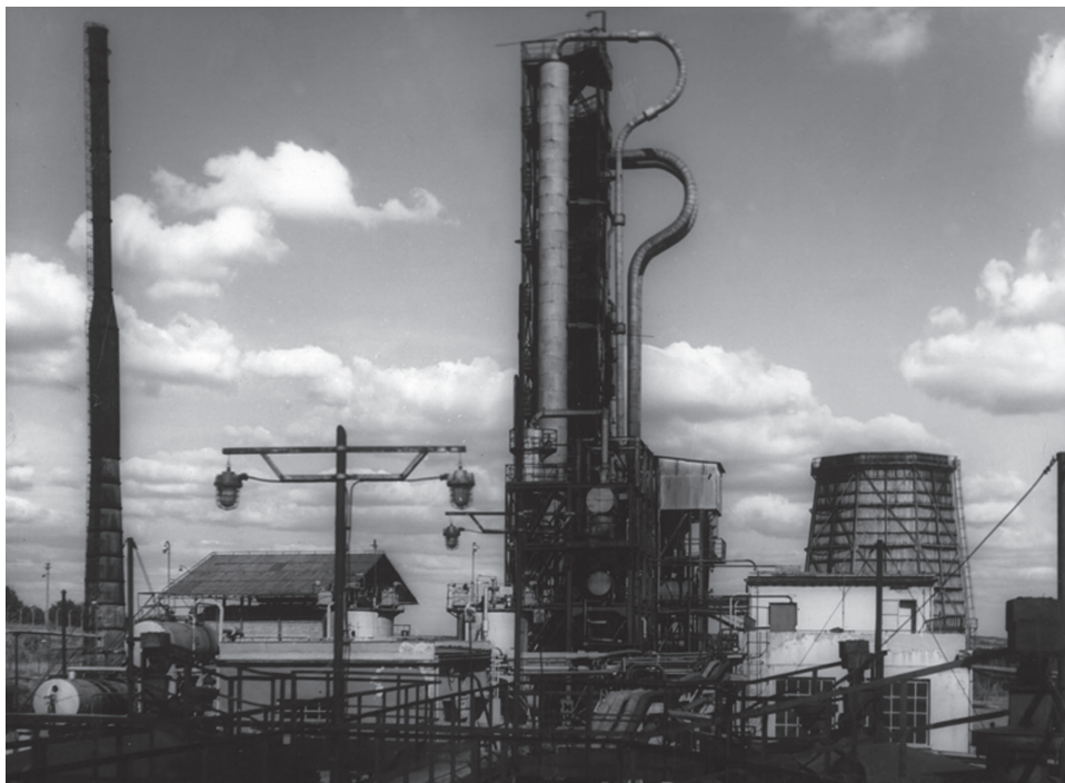
Instalacje Rafinerii Jedlicze – destylacja rurowo-wieżowa, lata pięćdziesiąte XX w. (zbiory FMPNiG w Bóbrce)

operacyjnego przed wrogą działalnością na obiekcie. A trudności te wynikają z tego powodu, że nie można wytypować odpowiedniego kandydata na werbunek, gdyż większość pracowników należy do PZPR, a pozostający bezpartyjni są to pracownicy w podeszłym wieku i nieumiejący w ogóle pisać, są to ludzie na niskim poziomie intelektualnym 65 . Oczywiście w takiej sytuacji bezpieczeństwa zmuszona była werbować w wyjątkowych przypadkach również członków PZPR zatrudnionych w zakładzie 66 .