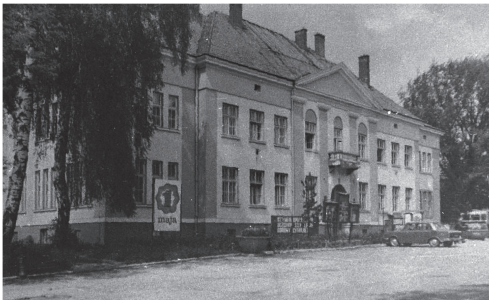
Budynek dyrekcji Przedsiębiorstwa Państwowego Rafineria Nafty Jedlicze, pomieszczenia Referatu Ochrony znajdowały się na piętrze po prawej stronie budynku – okna narożne

Pracownicy RO byli etatowymi funkcjonariuszami bezpieczeństwa i posiadali uprawnienia pracowników operacyjnych. Mogli werbować sieć agenturalno-informacyjną, prowadzić rozpracowania obiektowe i agenturalne, przesłuchiwać podejrzanych, świadków i biegłych oraz aresztować pracowników zakładu w przypadkach nagłych. Na terenie rafinerii za zgodą dyrekcji 25 poruszali się o każdej porze dnia i nocy oraz mieli wgląd do wszystkich dokumentów 26 . Kierownicy i pracownicy RO musieli być członkami Podstawowej Organizacji Partyjnej PZPR w zakładzie, w którym pełnili służbę 27 .