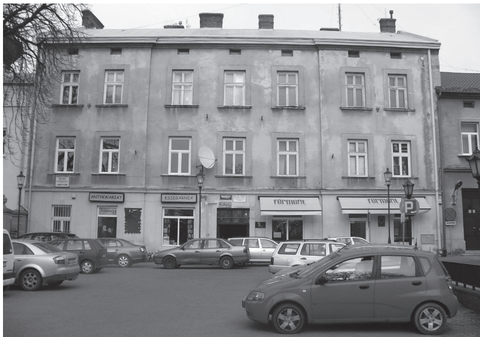
Budynek PUBP/PUdsBP w Krośnie od frontu przy ul. Wojciecha Portiusa 4 – stan obecny (fotografia z 2014 r.)

się do komunistycznego wojska z obawy przed aresztowaniem. Według sprawozdania kierownika PUBP w Krośnie chor. Fiałkowskiego z 25 grudnia 1944 r. do wojska zgłosiło się 95 oficerów, 16 podchorążych rezerwy, 237 podoficerów, 33 specjalistów, 887 poborowych z roczników 1921–1925 oraz 671 poborowych z roczników rejestracyjnych 1911–1920, a także 21 ochotników i 15 kobiet 103 .