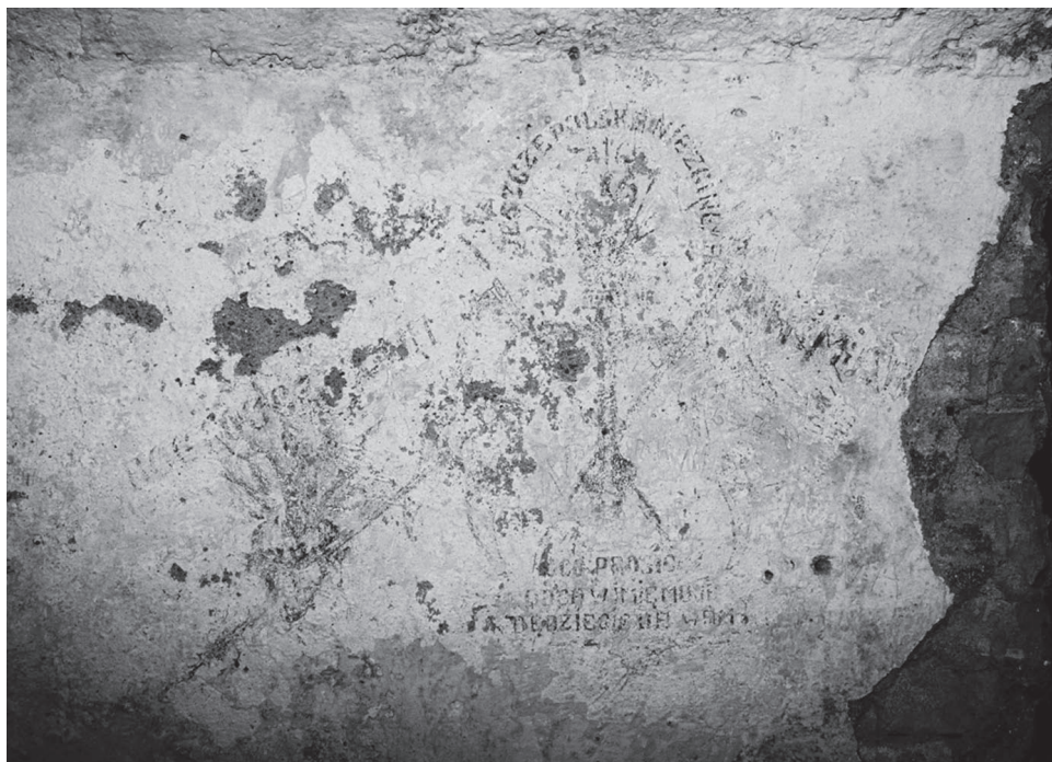
Napisy na ścianach celi

wody do celi po dwa razy na dobę, zamykanie nago w karczerze, stawianie z podniesionymi do góry rękami w czasie przesłuchania lub w celi, stawianie nago w nocy w okresie zimy przy otwartym oknie, rozrzucanie sieczonego siennika, pozbawianie spacerów oraz konwejer – wielogodzinne przesłuchania bez przerwy. Doprowadzało to aresztowanych do krańcowego wyczerpania fizycznego i psychicznego lub nawet do obłądania 258 . Oprócz tortur podczas przesłuchań zatrzymani byli szykanowani przez strażników aresztu oraz inwigilowani przez umieszczoną w celach ubecką agenturę prowokującą do zwierzeń i ujawniania informacji ukrytych przed śledczymi.