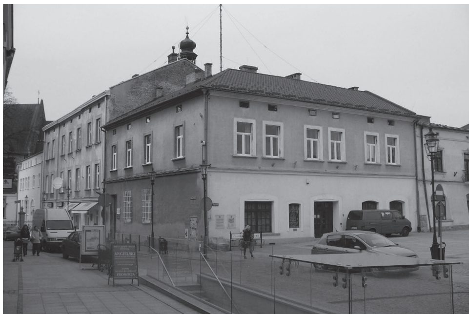
Budynek KP MO i PUBP/PUdsBP w Krośnie u zbiegu ul. Wojciecha Portiusa i Rynek – stan obecny (fotografia z 2014 r.)

Nasilający się terror i represje wobec AK oraz dekonspiracja jej struktur spowodowały, że znaczna liczba oficerów, podoficerów i żołnierzy podziemnej armii zgłaszała