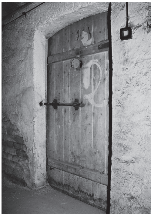
Drzwi do jednej z cel