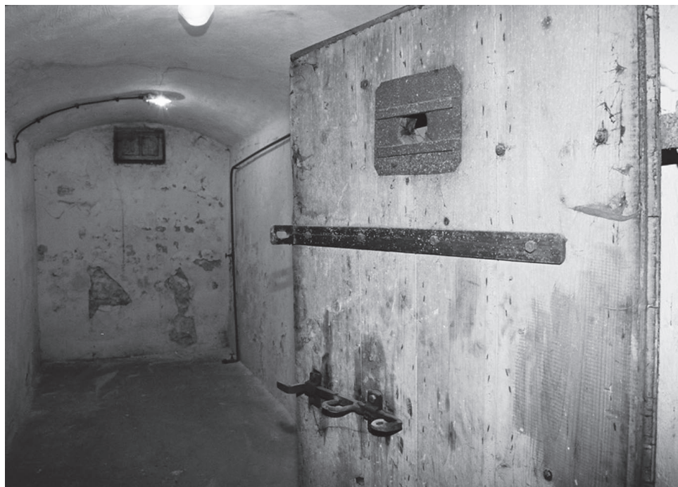
Wnętrze jednej z cel

zatrzymanych na dużą skalę posługiwano się fałszywymi zarzutami i prowokacją (np. podrzucanie broni) 256 .