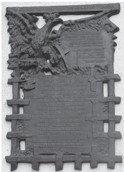
Tablica pamiątkowa na budynku byłego PUBP w Krośnie (fotografia z 2014 r.)

z okresu okupacji niemieckiej, tj. volksdeutscheów, współpracowników Gestapo i innych władz niemieckich 107 .